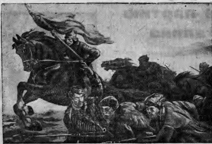
НА СНИМКЕ: „За советскую родину“. Картина художника И. М. Тондэ. „20 лет РККА и Военно-Морского Флота“.

В Москве открылась художественная выставка „20 лет РККА и Военно-Морского Флота“. На выставке представлено около 440 произведений живописи, скульптуры и графики виднейших мастеров советского искусства.