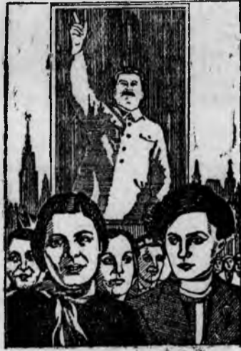
Плакаты Изюга работы художников М. Волковой и Н. Пинус. Рис. с репродукции Союзфото („Пресскляше“).

Да здравствует равноправная женщина СССР, активная участница в управлении государством, хозяйственными и культурными делами страны!